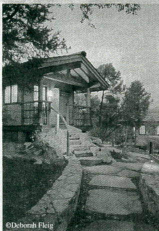
素材な竹まいの離れ。ここでマッサージが施される