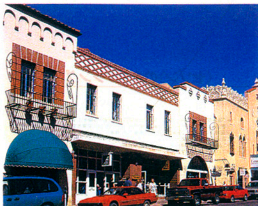
スペイン人によってつくられたサンタフェの街には、今もスペイン様式の建築が多く残り、エキゾチックな雰囲気を醸し出す。