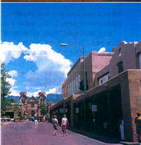
アートの街としても注目されているサンタフェ。中心部にはレストランや土産物屋に混じって、小さなギャラリーも立ち並び。