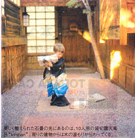
美しく整えられた石畳の先にあるのは、10人用の貸切露天風呂「Ichiban」。周りの建物からは木の温もりが伝わってくる。

お問い合わせ: Ten Thousand Waves (萬波) ☎505-982-9304 ☎505-989-5077 日本語窓口: カズ http://www.tenthousandwaves.com 所在地: 3451 Hyde Park Road Santa Fe, New Mexico, USA